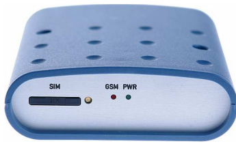
Standardversion mit Kunststoffgehäuse