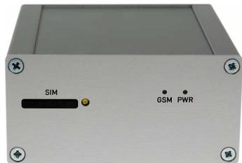
Version SL mit Aluminiumgehäuse